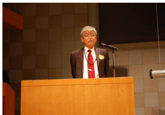
日本風力エネルギー学会 勝呂会長 挨拶