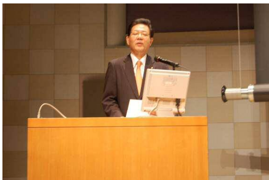
北橋市長 挨拶及び市政紹介