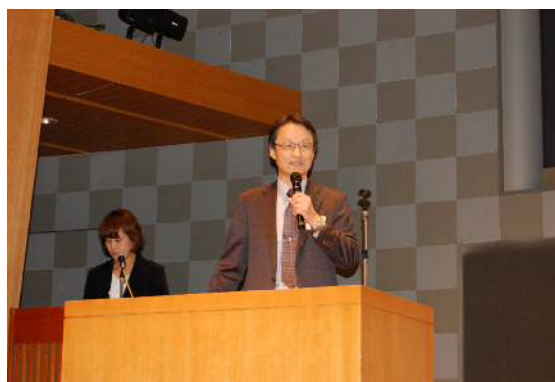
日本太陽エネルギー学会 荒川会長 挨拶