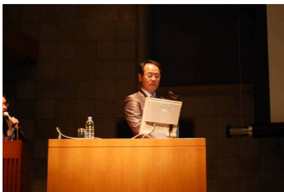
韓国太陽エネルギー学会 徐会長 講演