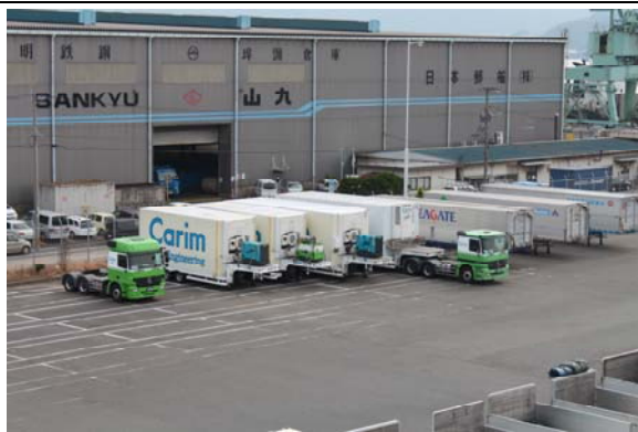
精密機器の国際複合一貫輸送 （国内RORO 国際RORO）

歓迎訪船の取材をご希望の方は、事前に立入制限区域への入場申請が必要となりますので、お手数ではございますが、6月2日12時までに、物流振興課までご連絡いただきますようお願いいたします。