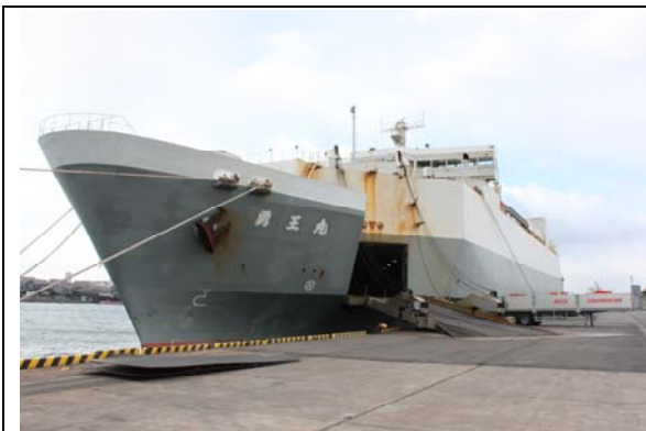
茨城港（常陸那珂）へ向けて 出港準備中の勇王丸

北九州港は半導体等製造装置の輸出では全国有数の拠点となっている。東日本地区で生産された精密機器製造装置が、このRORO航路を利用し北九州港経由で韓国、台湾、中国などへ輸出されている。